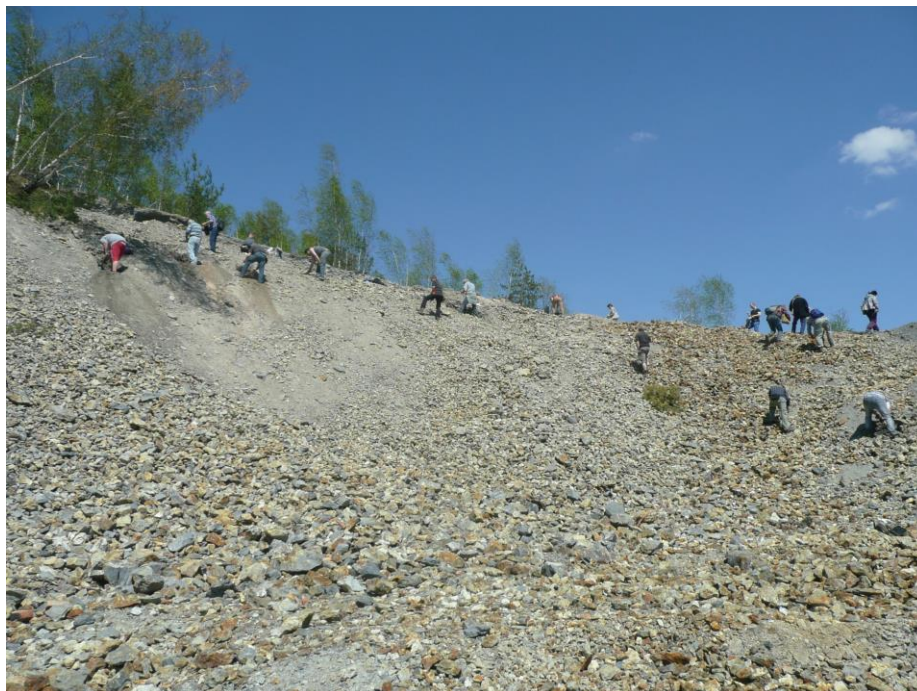
Sběr minerálů na haldě jámy I.+II. u Stříbra

Proběhla také dvě kola soutěže o nový významný mineralogický nález členů sekce na našich i zahraničních lokalitách. Činnost mineralogické sekce se tak daří i přes komplikace spojené s přístupem a přesouváním přednášek a besed do různých sálů nové budovy Národního muzea nadále rozvíjet.